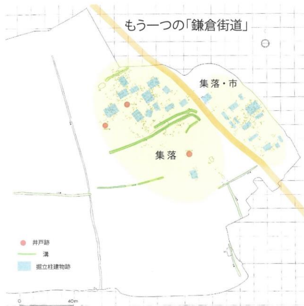
行司免遺跡調査区(中世) (1988嵐山町遺跡調査会より引用・加筆)

大蔵館跡の西側から行司免遺跡の中を通り、都幾川の対岸へ抜ける道は、縁切橋から分岐していたと考えられます。大蔵宿の集落(行司免遺跡)が存続していた14世紀頃までは、この道が「鎌倉街道」上道だったと考えられます。