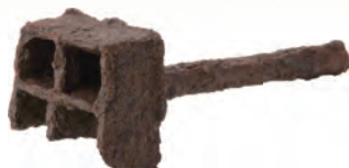
東の上遺跡出土焼印 (所沢市教育委員会蔵)