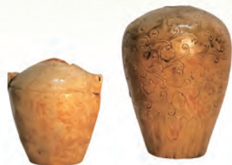
延慶の板碑下出土灰釉陶器 (毛呂山町教育委員会蔵)

本企画展では、近年の発掘調査の成果から、古代官衙、中世武士の館、宿などを取り上げ、道路の役割や、道路からみえる地域の姿について紹介します。