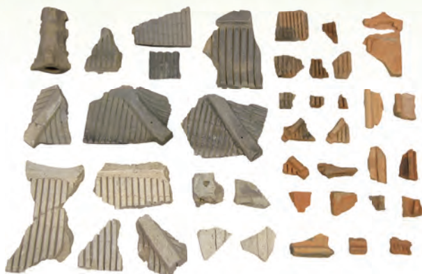
西別府廃寺出土瓦塔・瓦堂 (熊谷市教育委員会蔵)