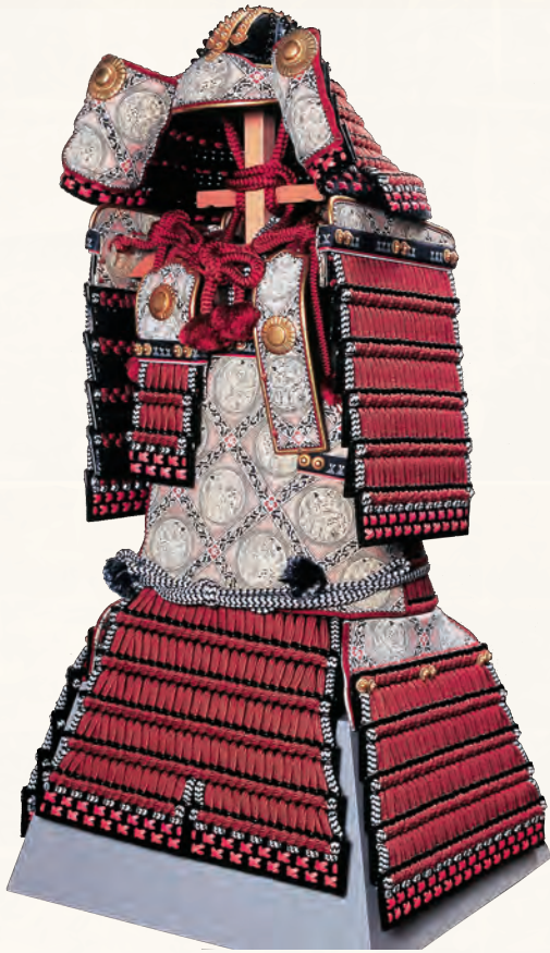
国宝「赤糸威大鎧」(武蔵御嶽神社 蔵) *写真・展示は復元模造(埼玉県立歴史と民俗の博物館 蔵)

本展では、武蔵武士の本拠や鎌倉にかかわる出土品や歴史資料から彼らの足跡を辿るとともに、地域に遺る武蔵武士や源氏の伝説にも注目し、「鎌倉殿」誕生の時代を紹介します。