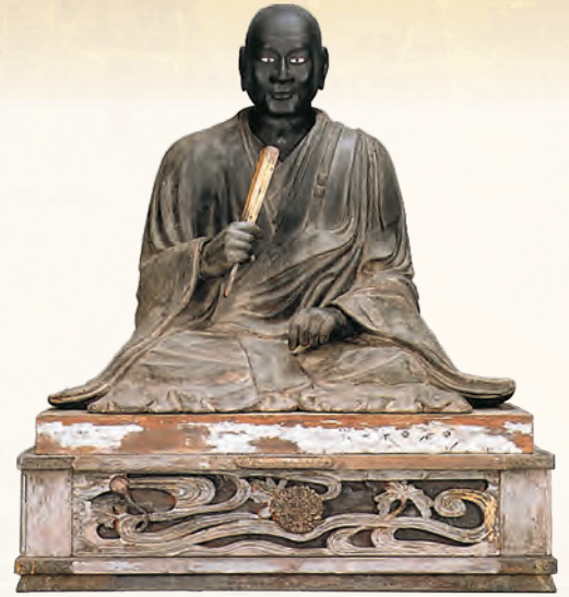
埼玉県指定文化財「木造 安達藤九郎盛長 坐像」(放光寺 蔵) *展示は複製品(埼玉県立歴史と民俗の博物館 蔵)