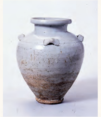
埼玉県指定文化財 「金蔵院出土白磁四耳壺」 (吉見町教育委員会 蔵)