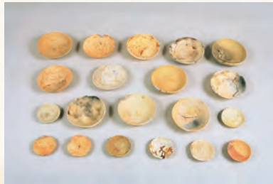
重要文化財「柳之御所遺跡出土 かわらけ」 (岩手県教育委員会 蔵)